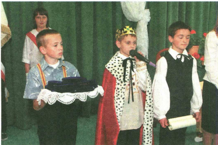
Uczniowie przedstawili w trakcie uroczystości słynną bajkę Janusza Korczaka „Król Masiuś I”.

W całej Polsce tyle szkół nosi imię Janusza Korczaka, a jedną z nich jest podstawówka w Kowali. Uczniowie są dumni z patrona i nikt nie żałuje, że 30 lat temu wybrano jego imię.