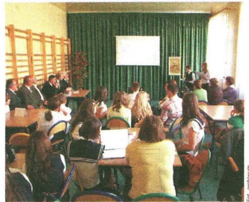
Szkolne samorzady prezentowały swoją działalność za pomocą pokazów multimedialnych