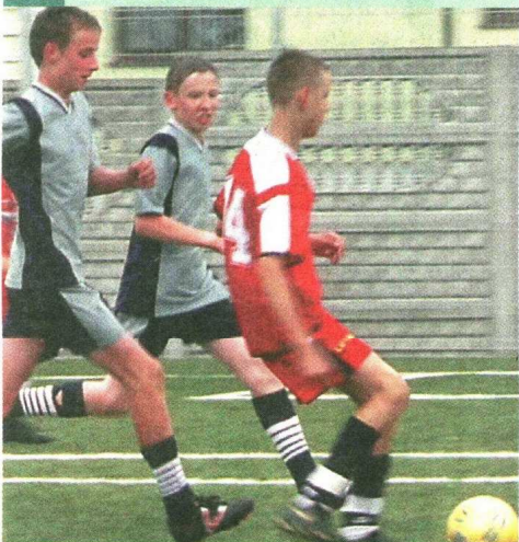
Podczas otwarcia boiska chłopcy z gminy Kowala i Radomia pierwsi wypróbowali plac do gry.

Dla całej gminy Kowala 30 maja zapisze się dużymi zgłoskami. Tego dnia w Mazowszanach uroczyste otwarto boisko wielofunkcyjne, o jakim marzy wielu młodych sportowców.