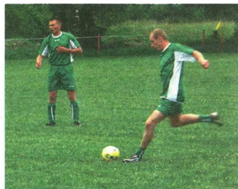
Fragment jednego ze spotkań ligowych o puchar wójta Kowala.