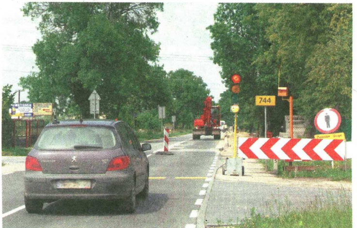
Na trasie z Mazowszan do Trabluc ruch odbywa się wahadłowo.