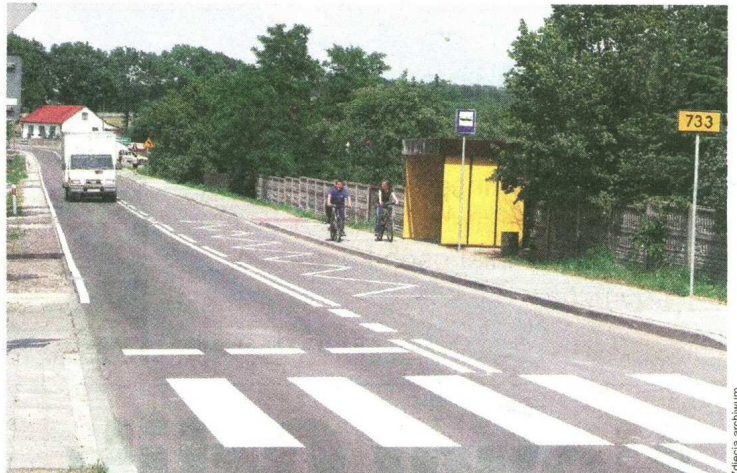
Odcinek od Augustowa do Kowali został niedawno oddany do użytku. Kierowcy mogą jeździć po nim z wielką przyjemnością.

- Być może jeszcze w tym roku uda nam się rozpocząć starania o budowę ronda w Parznicach. Jest to bardzo kosztowna inwestycja, bo sięga około pięciu milionów. Jednak myślę, że baczac na bezpieczeństwo kierowców i pieszych w tym miejscu rondo jest potrzebne.