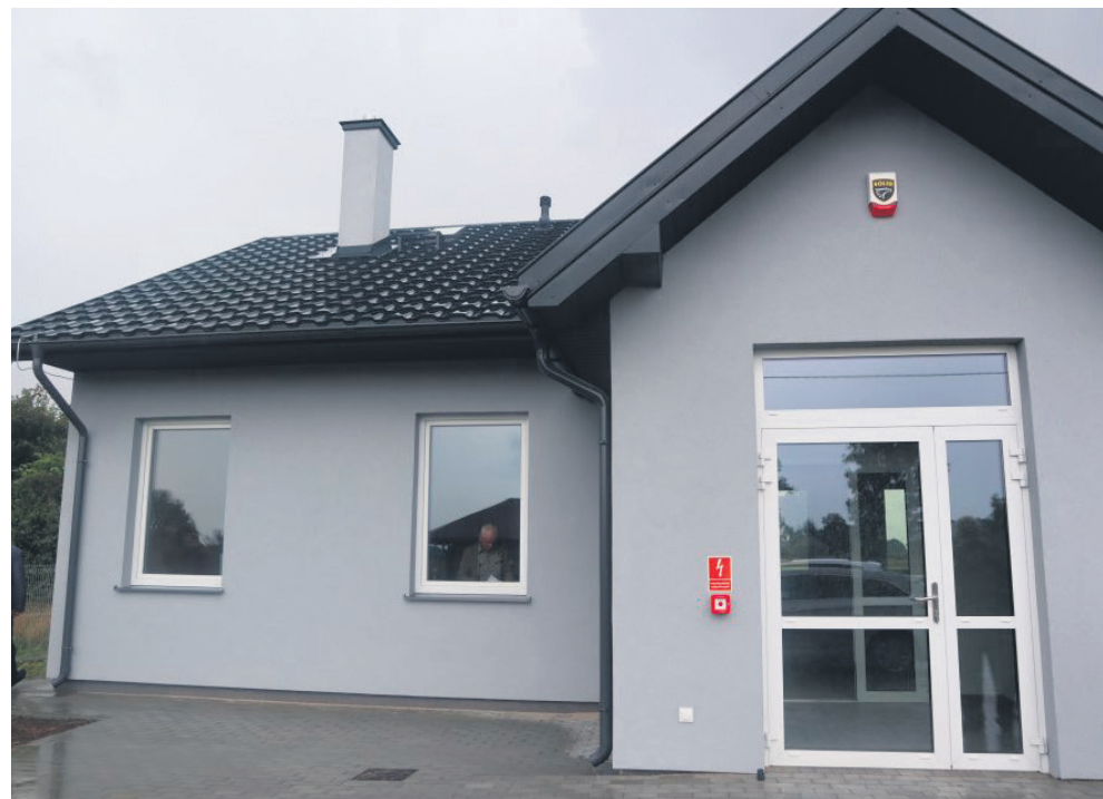
Podpis: Świetlica wiejska w miejscowości Maliszów

Zakres prac obejmował wykonanie budynku świetlicy, zagospodarowanie terenu oraz montaż zbiornika na nieczystości płynne.