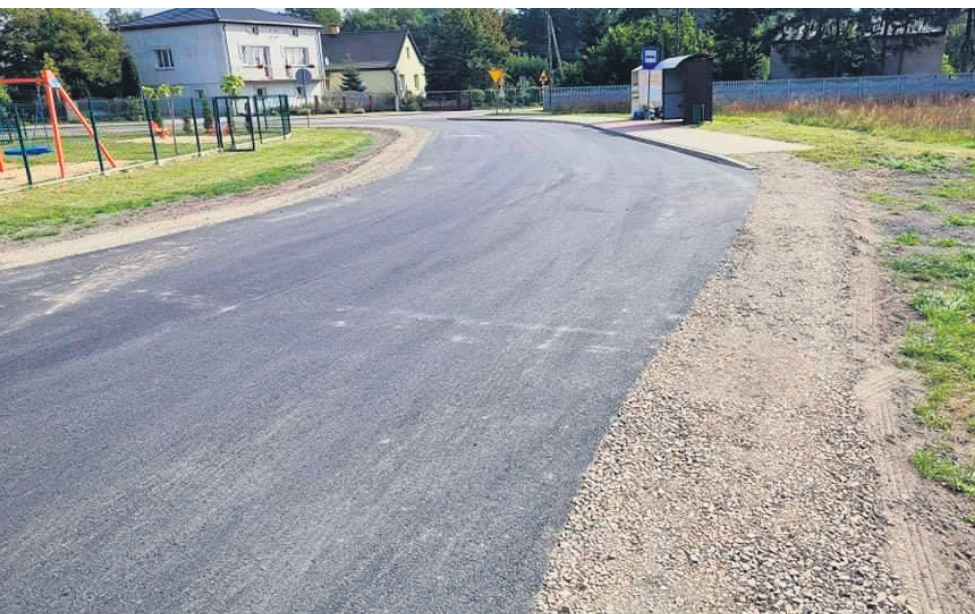
Pętla autobusowa w Rożkach

oraz zjazdów publicznych została zaprojektowana z uwzględnieniem istniejącego zagospodarowania. Teren zlokalizowany jest przy drogach publicznych (kategorii powiatowej oraz gminnej).