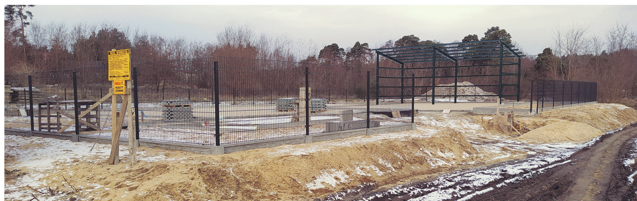
Budowa PSZOK w Kosowie i na terenie Gminy Wierzbica

na terenie gminy Kowala systemu gospodarowania odpadami komunalnymi. Projekt „Budowa Punktu Selektywnej Zbiórki Odpadów Komunalnych w Kosowie i na terenie Gminy Wierzbica” nr POI.02.02.00-00-0022/18 realizowany jest w ramach Działania 2.2 Gospodarka odpadami komunalnymi oś priorytetowa II Ochrona Środowiska, w tym adaptacja do zmian klimatu Programu Operacyjnego Infrastruktura i Środowisko 2014-2020.