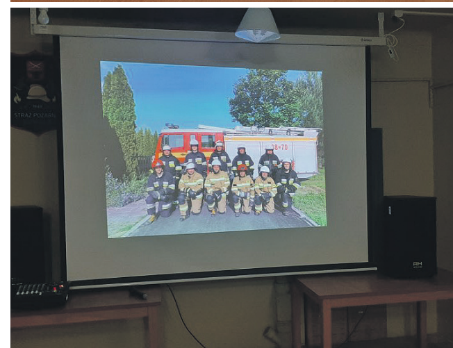
OSP Kowala wyposażona w nowy sprzęt