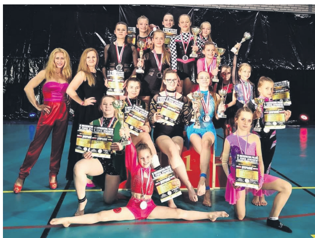
Gimnastyczny Klub Sportowy Quick Flik