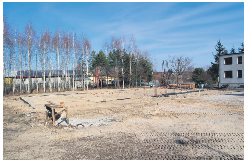
Plac budowy Remizy OSP w Kowali-Stępcinie

wykop pod ławy fundamentowe, wykonano ławy fundamentowe żelbetowe, skończono szalowania ścian fundamentowych, zaizolowane, docieplone i zasypane piachem, wykonano kanalizację sanitarną (poziomą), zostało wykonane utwardzenie terenu przed budynkiem.