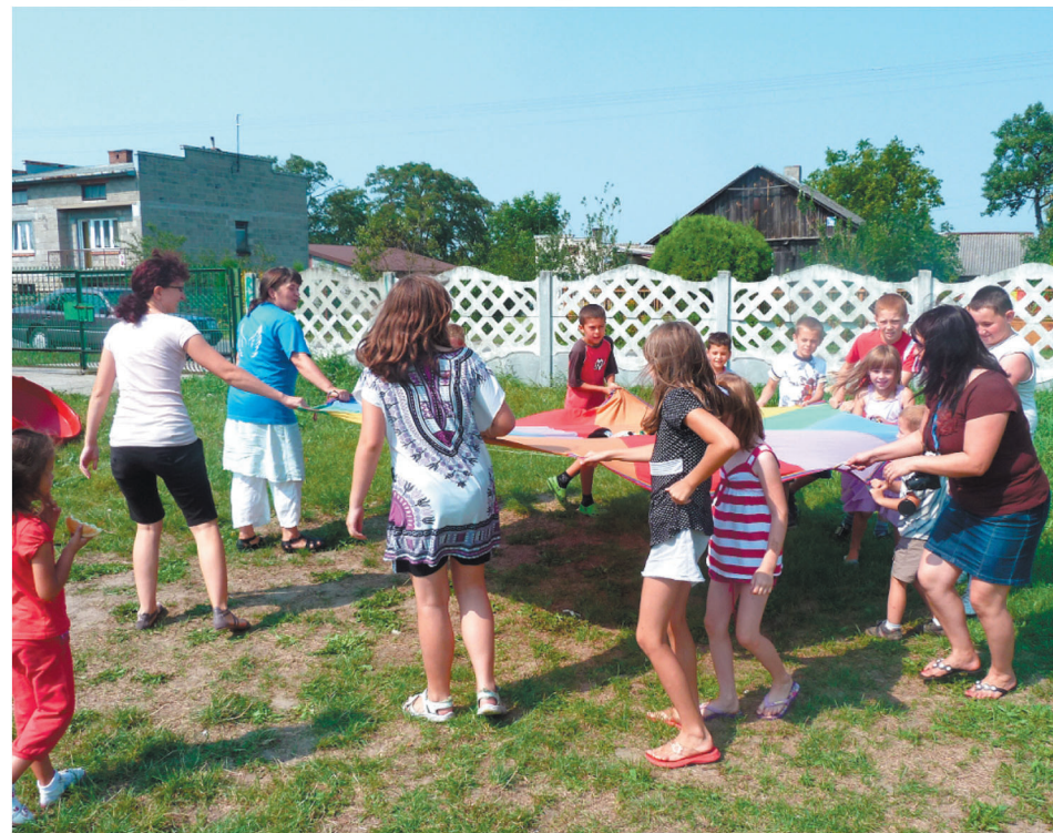
■ Świetlica to miejsce, gdzie bardzo chętnie przebywają tu dzieci

Dzieci z Dąbrówki Zabłotniej bardzo chętnie uczestniczą w świetlicowych zajęciach, które odbywają się w ramach projektu pod nazwą „Mały odkrywca wielkiego świata”.