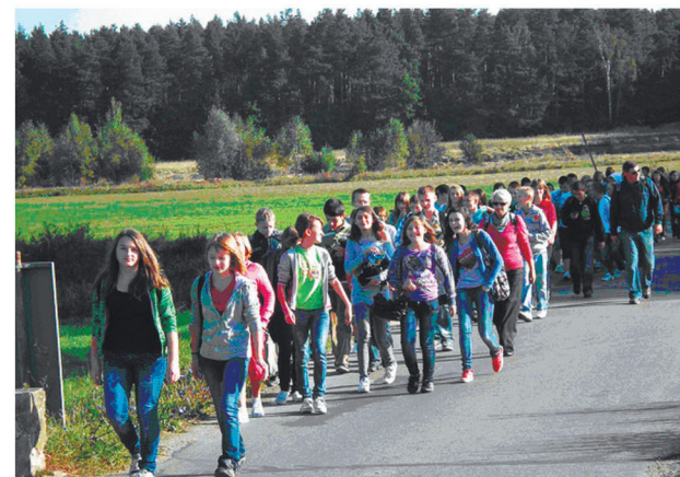
■ Młodzież z Gimnazjum z Parznic uwielbia piesze wycieczki

„Pierwszaki” zanim złożą uroczyste ślubowanie i otrzymają tytuł gimnazjalisty, muszą przejść szereg prób. Jedną z nich to właśnie piesza wędrówka na trasie Kowala - Orońsko - Kowala. W czasie marszu, młodzież ma możliwość lepszego poznania swoich nowych, szkolnych kolegów. Potem w Centrum Rzeźby w Orońsku, biorą udział w lekcji sztuki - podziwiając parkową galerię rzeźby. Odwiedzają Muzeum Rzeźby Współczesnej oraz poznają pracę artystów w poszczególnych pracowniach. Tegoroczny rajd spełnił swoje wychowawcze i edukacyjne zadanie. Młodzież wróciła do domu zadowolona i ma co wspominać.