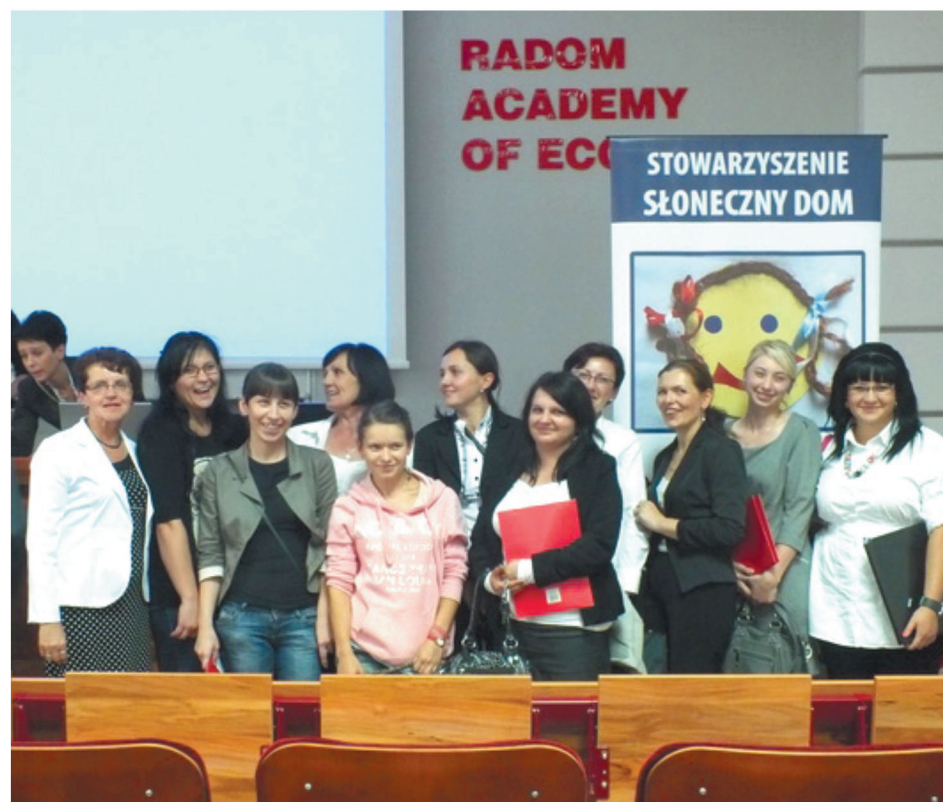
■ Pracownicy GOPS w Kowali wzięli udział w konferencji

W Radomiu, w siedzibie Wyższej Szkoły Handlowej odbyła się konferencja pod hasłem „Dopóki Masz Wybór” poświęcona problematyce profilaktyki uzależnień wśród dzieci i młodzieży. Jednym z punktów spotkania była prezentacja innowacyjnych działań Gminnego Ośrodka Pomocy Społecznej w Kowali.