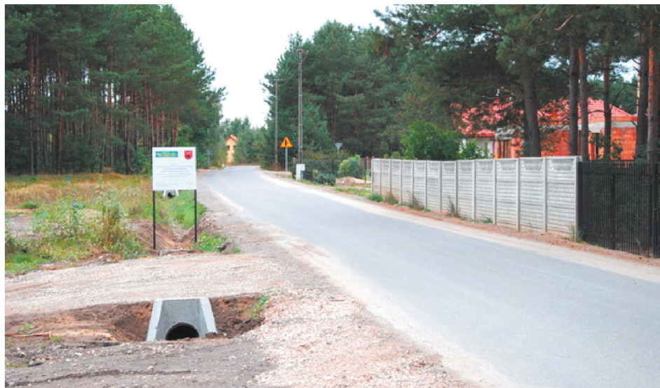
Nowa droga ułatwi życie wielu mieszkańcom.

Inwestycja została wykonana na terenie dwóch miejscowości gminy Kowala - w Mazowszanych i Hucie Mazowskańskiej. W tej drugiej miejscowości powstało 2679 metrów nawierzchni asfaltowej o szerokości pięciu metrów, wraz z pobocznymi, zjazdami na posesje