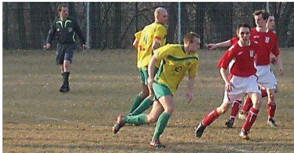
W rozegranym 18 marca meczu na własnym stadionie piłkarze Zorzy pokonali drużynę MKS Kozienice 7:1.

się z rozgrywek, drużyny, które miały zagrać z tą ekipą, otrzymują punkty walkowerem. Wyniki dotychczasowych spotkań zostały utrzymane, ale zespół Gryfii przesunięty został na ostatnie miejsce w tabeli i uznany jest za spadkowicza. W ten sposób, bez grania, punktowe konto Zorzy powiększyło się o kolejne trzy punkty, dzięki którym piłkarze awansowali na 4. miejsce w tabeli.