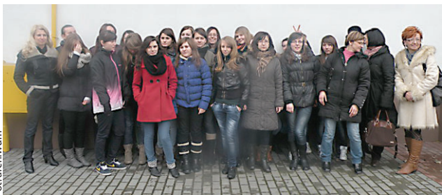
Wolontariusze z klubu przy Gminnym Ośrodku Pomocy Społecznej w Kowali mile spędzili czas w radomskiej Arce.

Młodzi ludzie z Klubu Wolontariusza przy Gminnym Ośrodku Pomocy Społecznej w Kowali oraz seniorzy wzięli udział w spotkaniu w Stowarzyszeniu Centrum Młodzieży Arka w Radomiu. Wizyta miała miejsce 13 marca. To jedno z wielu działań realizowanych przez GOPS w Kowali w projekcie „Na końcu będą Anioły - integracja pokoleniowa poprzez wolontariat”, dofinansowanego z Funduszu Inicjatyw Obywatelskich.