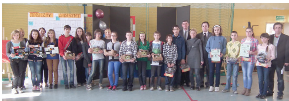
Najlepsze drużyny otrzymały atrakcyjne nagrody.

W piątek, 23 marca, w Publicznym Gimnazjum imienia Jana Pawła II w Parznicach odbył się turniej uczniów klas szóstych szkół podstawowych z terenu gminy Kowala. Była to już trzecia edycja „Gier i zabaw na wesoło” w Publicznym Gimnazjum