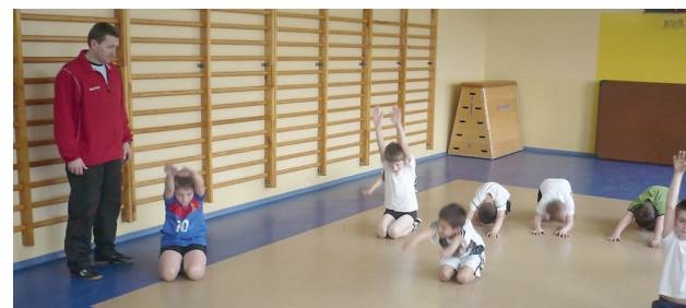
Już w nowym roku szkolnym uczniowie szkoły w Bardzicach będą mogli ćwiczyć w ciepłe dni na boisku z prawdziwego zdarzenia.