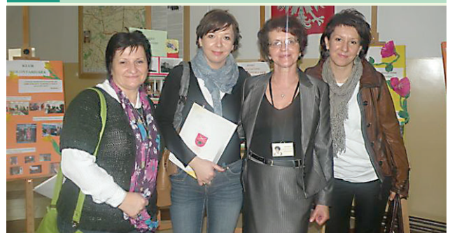
Spotkanie bardzo mile wspominają pracownicy GOPS w Kowali oraz pracownicy socjalni z województwa podlaskiego.

W piątek 23 marca Gminny Ośrodek Pomocy Społecznej w Kowali odwiedziła 25-osobowa grupa pracowników socjalnych z terenu województwa podlaskiego.