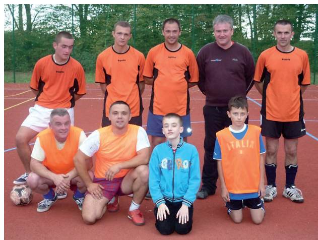
Zespół zwycięzców z Bardzic.

W Bardzicach rozegrano po raz pierwszy sołecki turniej piłkarski. Wystartowało sześć zespołów, a emocji było bardzo dużo. Wygrała ekipa gospodarzy.