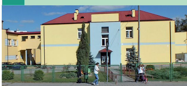
W sierpniu budynek podstawówki w Kowali został ocieplony, dzięki czemu szkoła zyskała nowy wygląd.

Dużym zaskoczeniem dla uczniów Publicznej Szkoły Podstawowej imienia Janusza Korczaka w Kowali był nowy wygląd szkoły. Nowy rok szkolny przywitani w pięknym ocieplonym budynku.