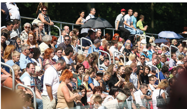
Widowisko obejrzały tłumy ludzi.