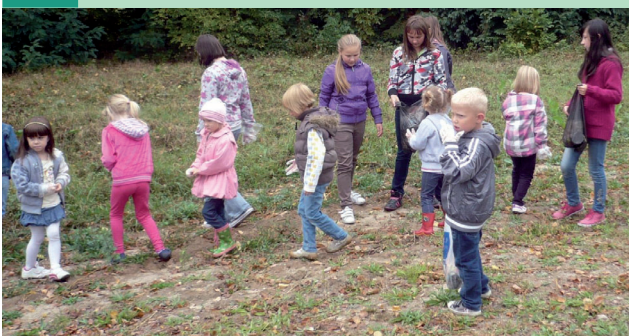
Uczniowie ze szkoły w Bardzicach wzięli udział w sprzątaniu świata.