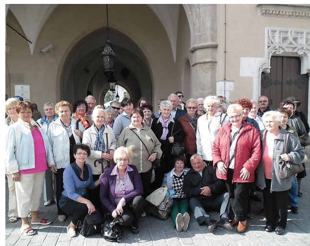
Seniorom z gminy Kowala bardzo spodobał się Kraków.

Członkowie Klubu Seniora przy Gminnym Ośrodku Pomocy Społecznej w Kowali, wybrali się w minioną sobotę do Krakowa.