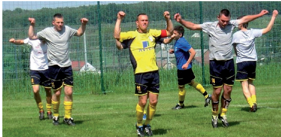
Piłkarze Zorzy Kowala ciężko pracują na treningach, więc efekty przyjdą z czasem.

Również w pojedynku z Centrum Radom 2:3, drużynie nie miała szczęścia. Dobre spotkanie podopieczni trenera Śledzia rozegrali z Zamłyniem Radom i zremisowali 1:1. W pojedynku z Radomiakiem II, Zorza nie miała zbyt wiele do powie-