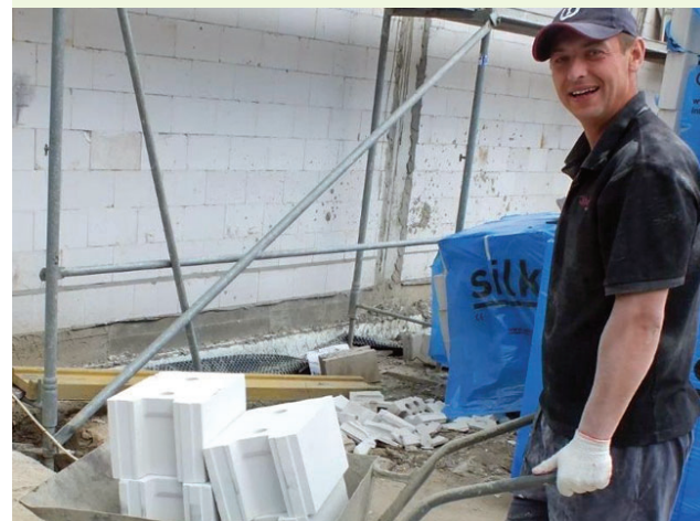
Trwa budowa sali gimnastycznej w Mazowszanach.