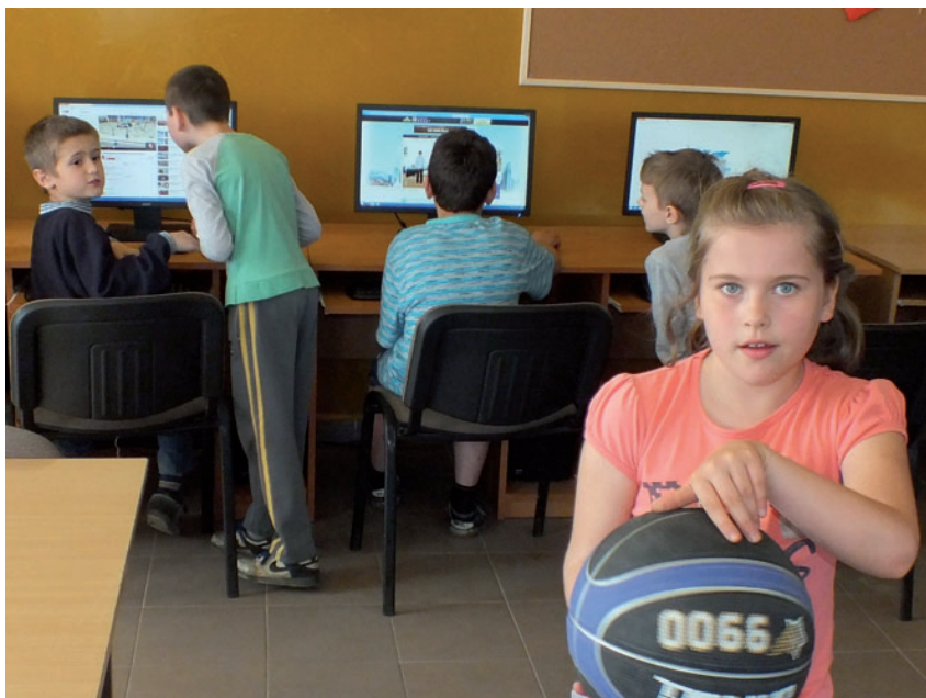
Dzieci chętnie korzystają z pracowni komputerowej w świetlicy w Rudzie Małej.

Czterdzieści zestawów komputerowych wraz z niezbędnym oprogramowaniem oraz dostępem do szerokopasmowego Internetu trafiło do rodzin w marcu tego roku. Ponadto dwadzieścia dwa komputery otrzymała Publiczna Szkoła Podstawowa w Bardzicach, pracownia komputerowa przy świetlicy „Szansa” w Kowali oraz świetlica w Rudzie Małej. Po rozliczeniu pierwszego etapu projektu gmina Kowala otrzymała zgodę na zagospodarowanie oszczędności, jakie powstały po rozstrzygniętych przetargach, na wsparcie dodatkowej grupy 10 mieszkańców gminy. Wszyscy beneficjenci projektu uczestniczą w szkoleniach, poznając zasady bezpiecznego korzystania z Internetu i możliwości jego użycia w życiu codziennym, uczą się między inny-