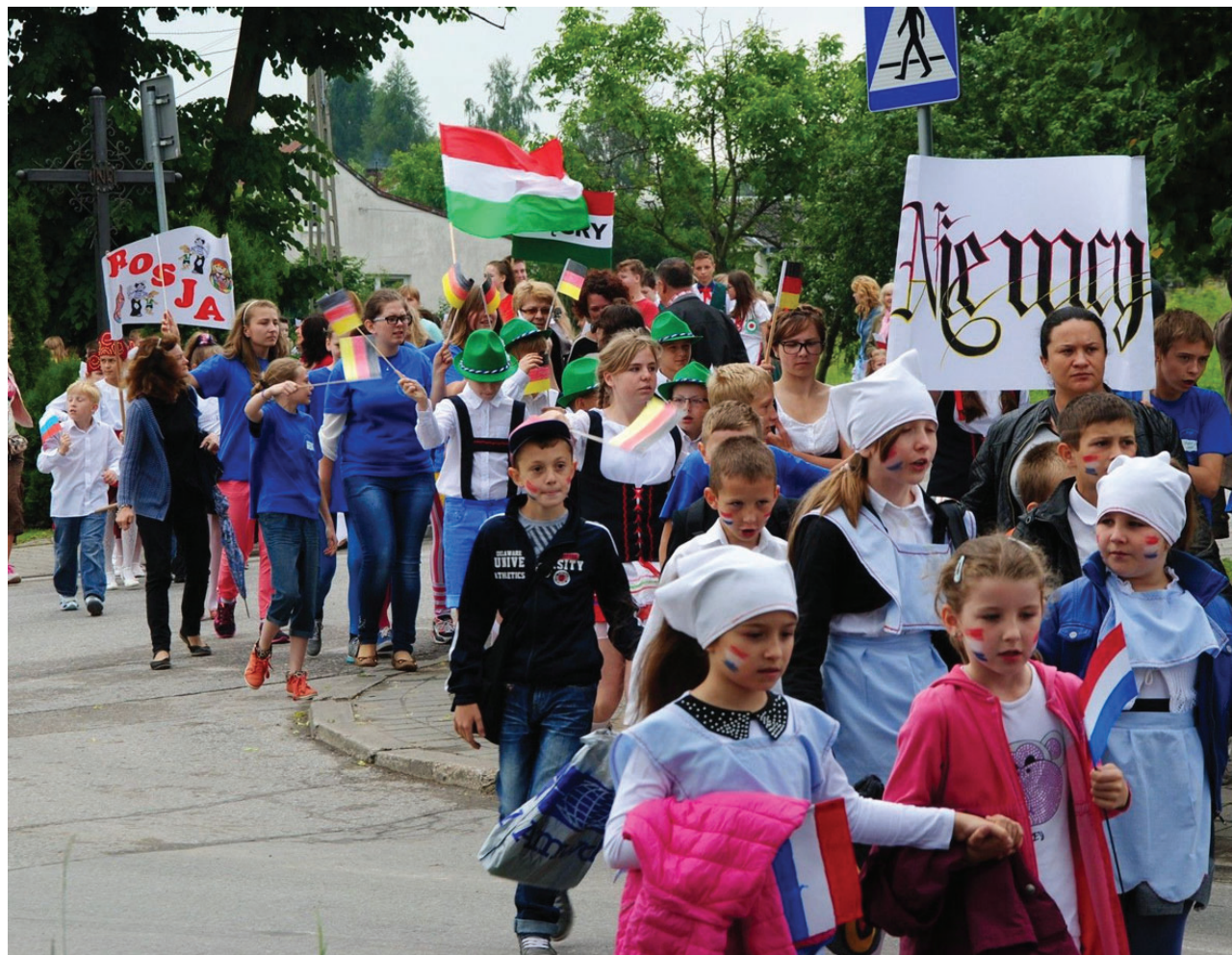
Barwny korowód różnych europejskich krajów przeszedł przez Kowalę.

Poprzez zabawę najmłodszy mieszkańcy gminy poznawali inne kraje i uczyli się tolerancji