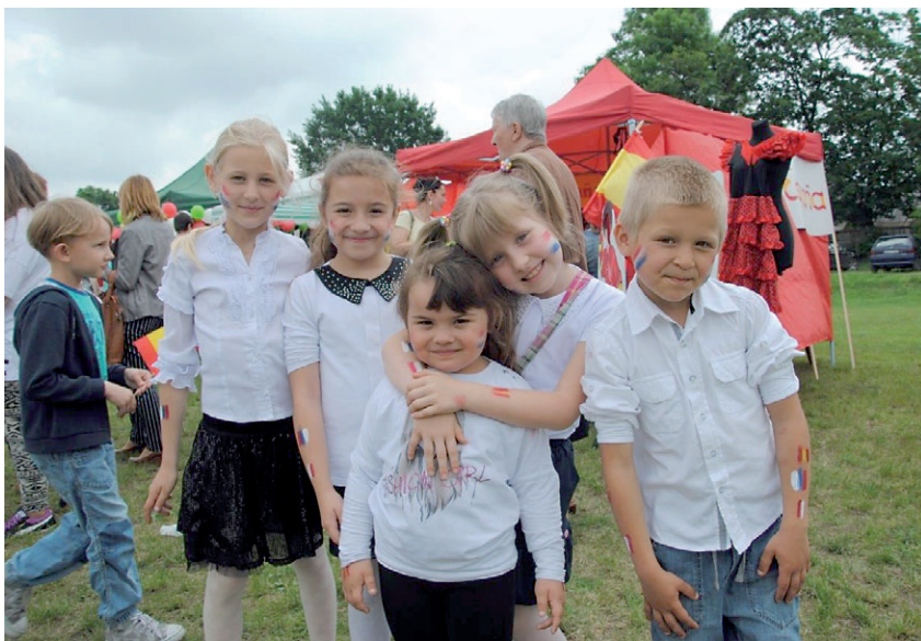
Dzieci chętnie korzystały z możliwości malowania twarzy.

Na skwerku młodzież zaprezentowała widowisko muzyczne składające się z charakterystycznych dla danego narodu pieśni. W hali przy Publicznej Szkole Podstawowej w Kowali szkoły przedstawiły tańce narodowe, a zaproszeni z zagranicy goście opowiadali o swoich ojczyznach w narodowych je-