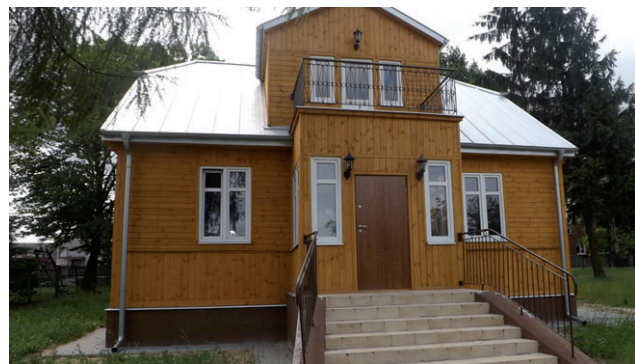
Budynek z zewnątrz jest już gotowy.