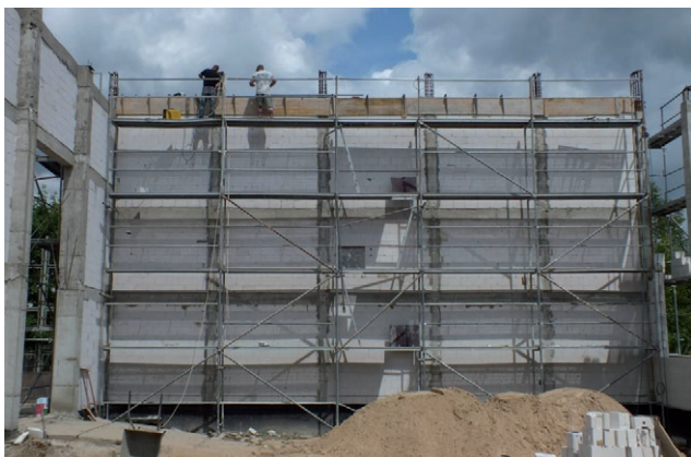
Prace przy budowie idą pełną parą.

D obre warunki atmosferyczne sprzyjają budowie sali gimnastycznej przy szkole podstawowej w Mazowszanych. Prace rozpoczęły się na początku roku i przebiegają zgodnie z planem. Jest to jedna z największych inwestycji oświatowo-sportowych realizowanych w ostatnich latach w gminie Kowala.