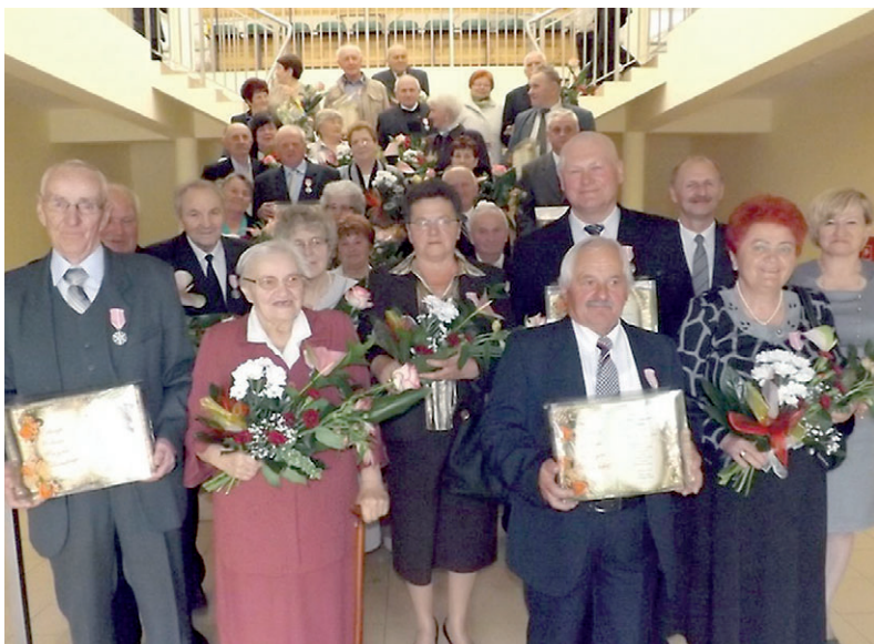
Medale otrzymało szesnaście par małżeńskich z gminy Kowala.