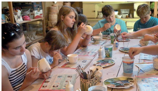
Na zajęciach ceramicznych każdy uczestnik według własnego uznania, pod czujnym okiem gospodyni malował i szkliwił własną filiżankę.

micznych, każdy z uczestników samodzielnie wykonał świętokrzyską czarownicę. Kolejnym niezwykle ciekawym warsztatem były zajęcia z zielarką, na których poznawali zastosowania ziół, które można spotkać na każdej łące. Były też warsztaty z „Biobudownictwa” i budowanie pieca z patyków, gazet i gliny. Młodzież obejrzała spektakl oparty na motywach świętokrzyskich legend „Bajka o diable Fajferku i Babie”. Drugi dzień rozpoczął się pieszą wycieczką do stadniny „Manoh”. Później były zajęcia kulinarne w „Laboratorium swojskiego smaku”, a na zakończenie zajęcia