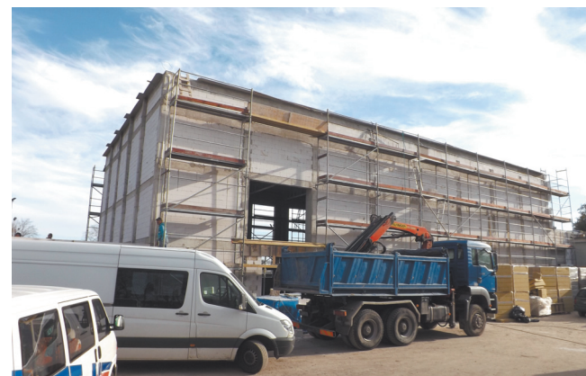
Budowa sali przy szkole w Mazowszanach jest współfinansowana z Programu Rozwoju Bazy Sportowej Województwa Mazowieckiego w kwocie 400 tysięcy złotych.

w funkcjonalne meble przedszkolne, pomoce dydaktyczne, zabawki edukacyjne, sprzęt audiowizualny i tablice interaktywne. W szkołach wykona-