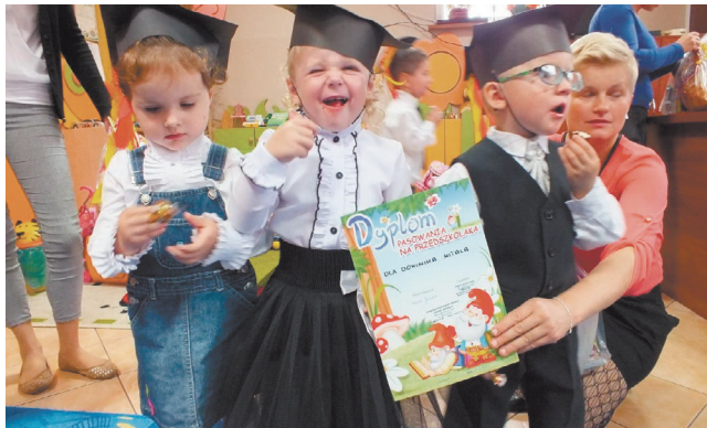
Uroczystość pasowania na przedszkolaka w punkcie przedszkolnym „Dziecięcy Raj” działającym od września w budynku świetlicy wiejskiej w Trablicach.

Szczegóły akcji omówione zostały podczas spotkania wójta gminy Kowala z przedstawicielem III Komisariatu Policji w Radomiu, które odbyło się 27 października.