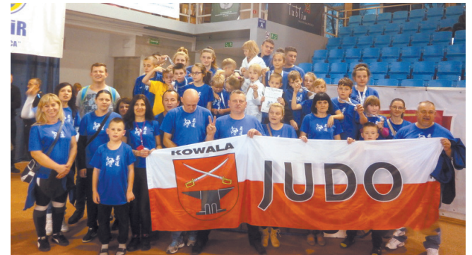
Judocy z Kowali przywieźli 15 medali

Powalczyli w Lublinie i wrócili z sukcesami