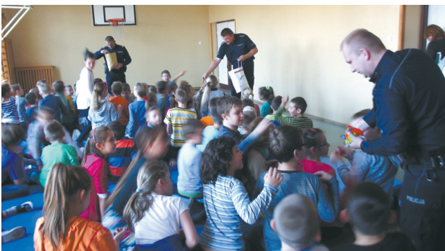
Pierwsze spotkanie odbyło się w podstawówce w Mazowszanych.

Odblaskowe elementy mogą uratować życie i zdrowie. Dzieci ze szkół podstawowych z terenu gminy Kowala biorą udział w pogadankach na temat bezpieczeństwa na drodze po zmroku. Urząd Gminy w Kowali w partnerstwie z III Komisariatem Policji w Radomiu rozpoczął akcję „Bezpieczni po zmroku” skierowaną o uczniów szkół podstawowych z terenu gminy Kowala. W szkołach już rozpoczęły się spotkania z policjantami, a wszystkie dzieci z klas I-III otrzymują odblaskowe zawieszki zakupione z budżetu gminy.