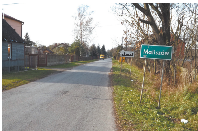
Mieszkańcy Maliszowa w 2015 roku będą mieć nową drogę.

Obszarów Wiejskich do czerwca 2015 roku zakończony zostanie projekt pod nazwą „Budowa infrastruktury wodno-ściekowej na obszarze gminy Kowala” polegający na budowie studni dla ujęcia wody oraz modernizacji stacji w Dąbrówce Zabłotniej. Natomiast dzięki dotacji wynoszącej 573 tysiące złotych z Programu Operacyjnego Kapitał Ludzki powstaną kolejne nowoczesne i bezpieczne plac zabaw, a placówki oświatowe zostaną wyposażone