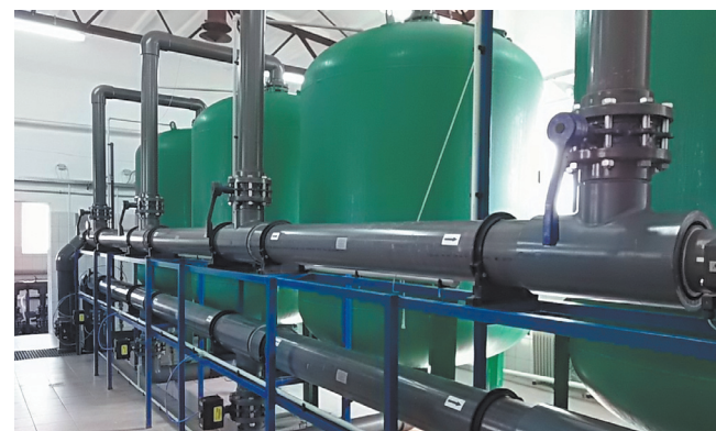
Modernizacja stacji wodociągowej w Dąbrówce Zabłotniej uzyskała dotację unijną.

ne zostaną remonty łazienek, wyposażone zostaną kuchnie i zakupione urządzenia do utrzymania czystości w pomieszczeniach.