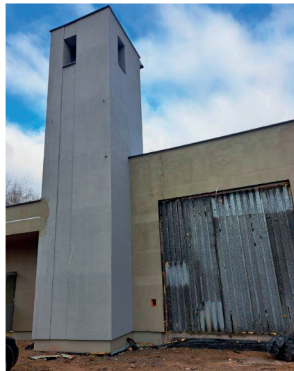
Budowa Remizy OSP w miejscowości Kowala-Stepocina

sowana z dotacji z budżetu Województwa Mazowieckiego w ramach „Instrumentu wsparcia zadań ważnych dla równomiernego rozwoju województwa mazowieckiego” w kwocie 1 078 497,02 zł, z montażem finansowym na poszczególne lata oraz ze środków z budżetu gminy. W wyniku przeprowadzonego postępowania przetargowego wykonawcą robót została firma SKADAR Arkadiusz Skawiński.