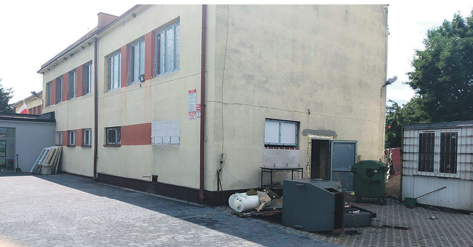
Termomodernizacja w Publicznej Szkole Podstawowej w Młodocinie Mniejszym