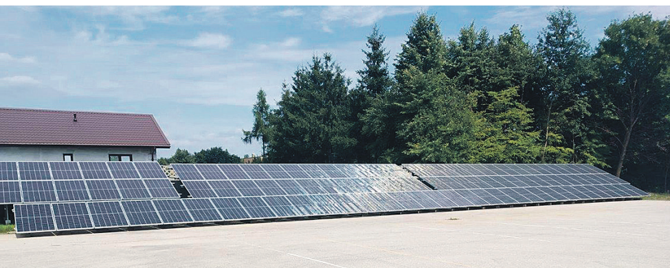
Termomodernizacja budynku Publicznej Szkoły Podstawowej w Młodocinie Mniejszym

nowe, wymiany okien zewnętrznych na nowe, ocieplenie stropodachu, modernizacja instalacji ciepłej wody użytkowej, wymiany pokrycia dachowego wraz z pracami towarzyszącymi oraz dostosowanie pomieszczenia kotłowni do wymogów nowego źródła ciepła.