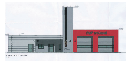
Wizualizacja siedziby OSP Kowala