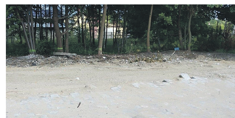
Teren pod budynek OSP KOWAŁA

„Instrumentu wsparcia zadań ważnych dla równomiernego rozwoju województwa mazowieckiego” z montażem finansowym na poszczególne lata oraz ze środków z budżetu gminy. Investycja będzie realizowana w latach 2021-2023.