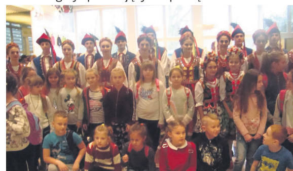
Członkowie zespołu tańca ludowego „Przepióreczka” w Otrębusach

Mali tancerze z 2a i 2b spotkali się oko w oko z członkami, słynnego na cały świat, polskiego zespołu ludowego. Program wizyty był bardzo bogaty i pouczający. Na początku dzieci uczestniczyły w pięknym koncercie edukacyjnym pt. „Fantazja Polska - Polskie Tańce Narodowe”, dzięki któremu mogły bliżej poznać pięć polskich tańców narodowych. Oglądanie „na żywo” występu tak znakomitych tancerzy było ogromnym przeżyciem. Przy okazji przybliżono oglądającym sylwetki znakomitych polskich kompozytorów: pianisty – Fryderyka Chopina i skrzypka – Henryka Wieniawskiego. Kolejnym etapem wyjazdu do Otrębusów były warsztaty, na których nasi szkolni artyści pod okiem fachowców z „Mazowsza” mogli doskonalić swoje umiejętności wokalne i taneczne, co upamiętniają wspólne fotografie.