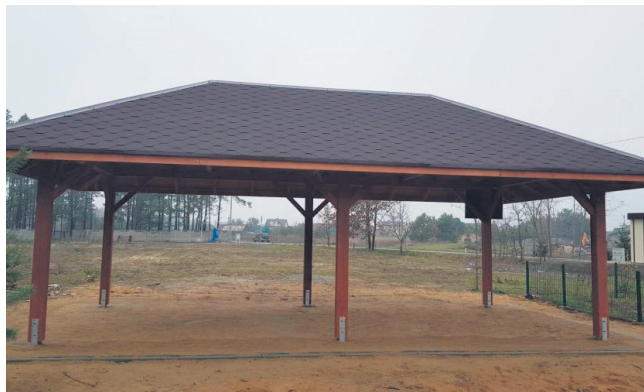
Altana w miejscowości Huta Mazowszańska

Zakończyła się budowa altany w Hucie Mazowszańskiej. Inwestycja ta została zrealizowana w ramach funduszu sołectw. Koszt wykonanych robót wynosi 30 000,00 zł.