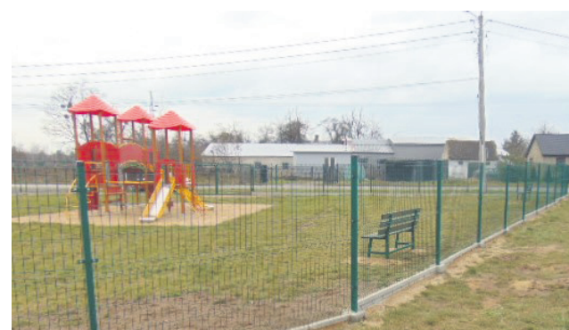
Ogrodzenie placu zabaw w Rożkach

Zakończyły się prace związane z budową ogrodzenia placu zabaw w miejscowości Rożki. W ramach inwestycji wykonano ok. 90,0 m ogrodzenia wraz z bramą i 2 furtkami oraz zamontowano 2 ławki. Koszt wykonanych robót wynosi 33 210,00 zł.