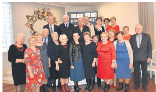
Seniorzy Gminy Kowala

5.12.2019 r. w Zajeździe Rybackim „Złoty Karpik” w Kosowie odbyła się konferencja pod nazwą: „Spójrz inaczej” skierowana do mieszkańców gminy Kowala, szczególnie osób z niepełnosprawnością, seniorów oraz przedstawicieli służb pracujących na rzecz rodzin. Honorowy patronat nad konferencją objął Wójt Gminy Kowala.