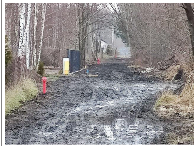
Budowa wodociągów w Kotarwicach i Kowali Kolonii

Sieć wodociągowa będzie dostarczała wodę do celów bytowo-gospodarczych i zabezpieczała potrzeby przeciwpożarowe dla istniejących posesji zlokalizowanych na tym terenie oraz wybudowanych w przyszłości.