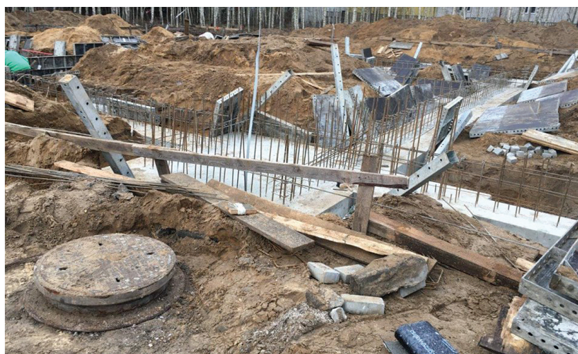
Plac budowy Remizy OSP w Kowali-Stepocinie