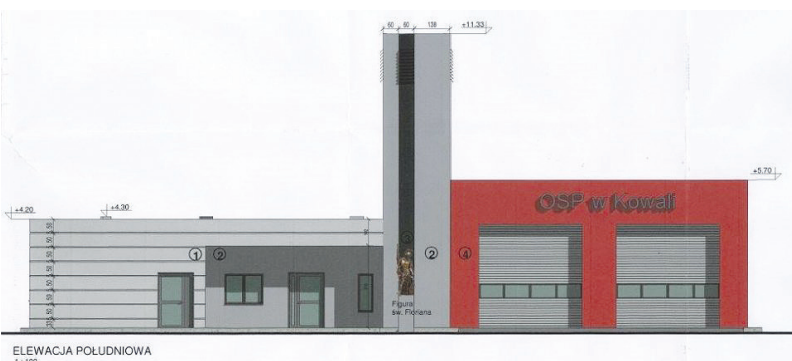
Projekt Remizy OSP w Kowali-Stepocinie