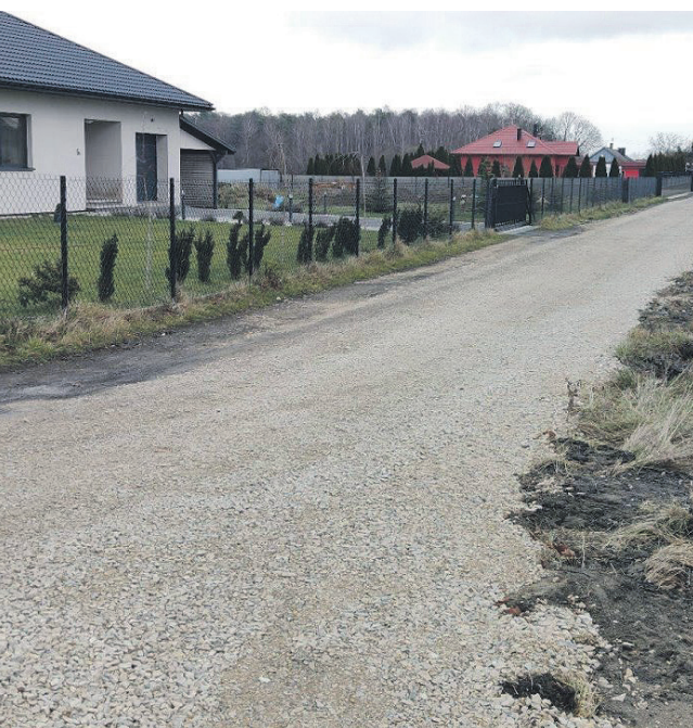
Utwardzenie dróg gminnych

Kowala - Kolonia (obręb 0012 Kowala). Koszt inwestycji wyniósł: 228 411 zł.