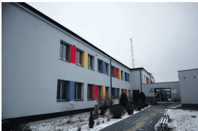
Publiczna Szkoła Podstawowa w Młodocinie Mniejszym

Dzięki pozyskanemu w ramach Regionalnego Programu Operacyjnego Województwa Mazowieckiego dofinansowaniu unijnemu zmodernizowano instalację centralnego ogrzewania, instalację ciepłej wody użytkowej, ocieplono stropodach, ściany zewnętrzne, wymieniono okna oraz drzwi zewnętrzne, zamontowano instalację fotowoltaiczną. Koszt realizacji projektu wynikający ze złożonego wniosku o dofinansowanie to 6 814 471,83 zł, z czego z środków unijnych w formie