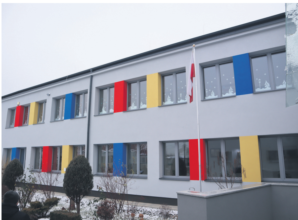
Publiczna Szkoła Podstawowa w Młodocinie Mniejszym

W roku 2022 Gmina Kowala kontynuuje realizację projektu, który uzyskał dofinansowanie unijne w ramach RPO WM. W 2021 r. + zakończono prace termomodernizacyjne w PSP w Młodocinie Mniejszym. Zmodernizowano instalację centralnego ogrzewania, instalację ciepłej wody użytkowej, ocieplono stropodach, ściany zewnętrzne, wymieniono okna oraz drzwi zewnętrzne, zamontowano instalację fotowoltaiczną. Budynek jest już od kilku miesięcy w pełni użytkowany przez dzieci oraz kadrę nauczycielską. Koszt realizacji projektu wynikający ze złożonego wniosku o dofinansowanie to 6 814 471,83 zł, z czego pozyskane w formie dotacji środki unijne to 3 997 960,02 zł.